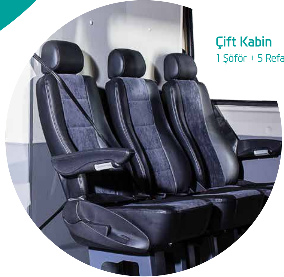
Çift Kabin 1 Şöför + 5 Refakatçi